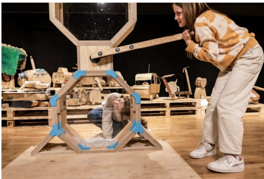
Möjlighetsmaskiner, pedagogiskt projekt 2023/2023. Finansierat av Postkodstiftelsen. (Karl Melander)

Sedan konstmuseibyggnaden stängde i slutet av 2019 har konstmuseiverksamheten bedrivits i lika hög grad som tidigare genom utställningar på Fornsalen samt på andra platser runtom på Gotland, i samverkan med olika aktörer och samverkanspartners. Flera större pedagogiska projekt har möjliggjorts med medel från bl a Arvsfonden och Postkodstiftelsen.