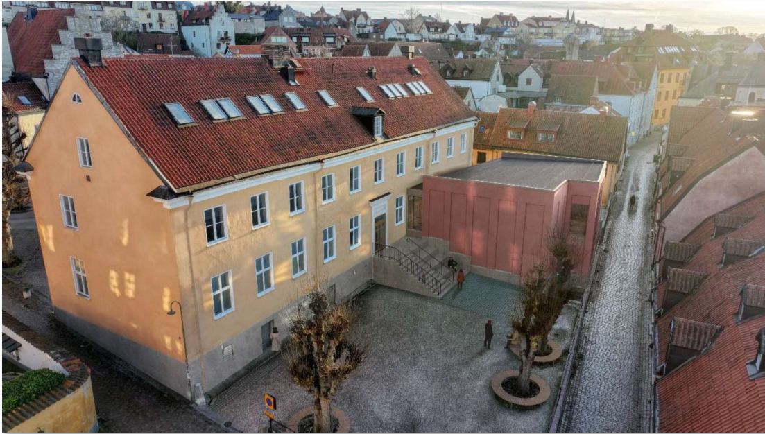
Visionsbild av tillbyggnaden, framtagen under projekteringen (SWECO)

Parallellt med projekteringen av om- och tillbyggnaden tas bygglovshandlingar, systemhandlingar och förfrågningsunderlag för en samverkansentreprenad fram. Dessa handlingar beräknas finnas klara under våren 2025.