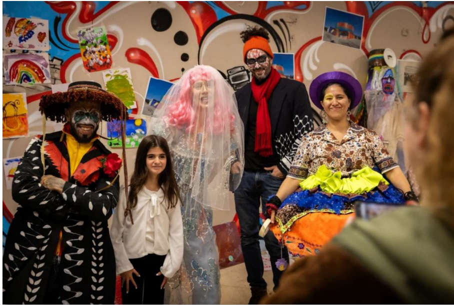
Bingan gemenskapar, hösten 2024. (Karl Melander)

När verksamheten tidigare bedrevs i konstmuseihuset var öppettiderna tisdag till söndag, kl 12-16, samt något utökat på sommaren. Museets besöktes årligen av ca 12 000 besökare. I den satsning vi önskar göra framåt, med kvalitativa utställningar, pedagogiska projekt och med den samverkan vi hoppas uppnå med Resurscentrum för konst och form samt BAC är målet att nå ca 40 000 besökare och att byggnaden ska blir den självklara noden för konst- och formområdet på Gotland. Om detta ska uppnås krävs utökade öppettider samt ökade resurser för pedagogik och bemanning i huset. Denna satsning ger också ökade intäkter i form av entréer, konferensverksamhet och lokalhyror.